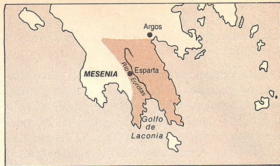
5.6 Lacedemonia: territorio de Esparta.

● Fue una polis totalitaria , dirigida por una aristocracia militar. Sólo los espartanos de origen dórico